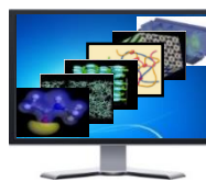
シミュレーション設計