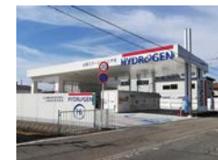
北陸初の富山 水素ステーション