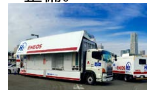
移動式 水素ステーション