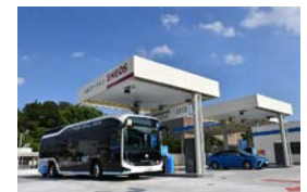
FCバス対応 水素ステーション