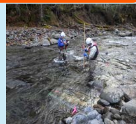
流量調査・測量作業

民間事業者や地方公共団体が行う、新たな水力発電事業の実施にあたり必要となる調査、設計及び流量観測等に必要となる機器、作業道整備等に資する費用を支援します。また、水力発電事業の実施にあたり、事業者が立地地域との課題解決や、共生を図るために実施する事業を支援するとともに、国内外の技術情報の収集を実施します。