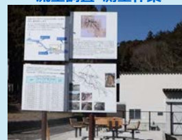
地域の理解促進に係る環境整備