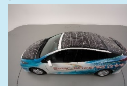
狭い面積でも十分な駆動力が得られる車載用太陽電池モジュール