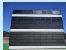
ビル壁面に太陽光パネルを設置した例