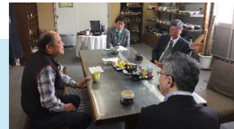
被災事業者への個別訪問