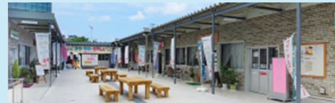
中小機構が設置した仮設施設