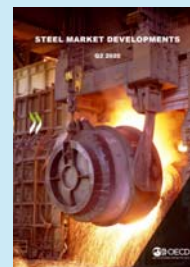
STEEL MARKET DEVELOPMENTS