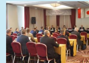
（専門家が講演するセミナーの開催）