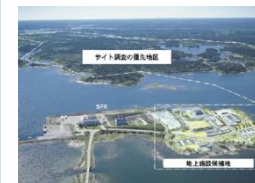
使用済燃料処分場予定地 （フォルスマルク）