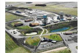
ビュール地下研究所 （ムーズ県、オート＝マルヌ県）