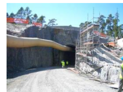
使用済燃料処分場（建設中） （オルキルオト）