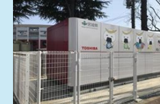
次世代エネルギー設備 （水素利活用等）