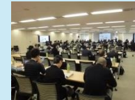
エネルギーに関する勉強会や 対話の場の開催