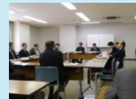
地域エネルギー ビジョンの策定