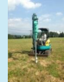
設備設置に向けた 調査・実証研究