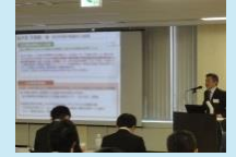
再エネ・省エネ等の 技術開発