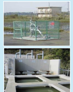
水溶性天然ガス生産設備