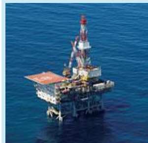
海上プラットフォーム