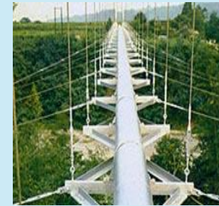
天然ガスパイプライン