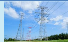
送配電・需給管理