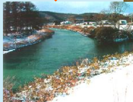
対策を講じた河川 （現在）