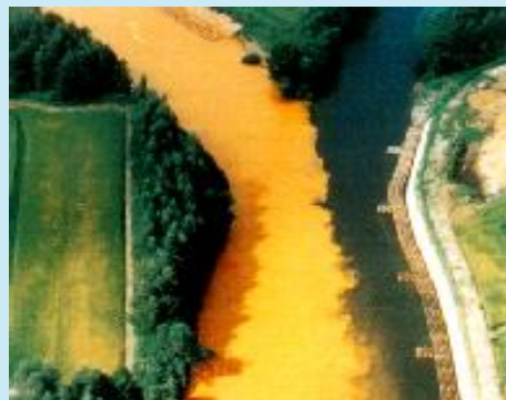
汚染された河川 （昭和49年当時）