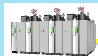
エネルギー消費効率の 高いボイラー