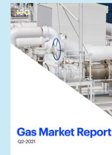
Market Report Series: Gas 2020