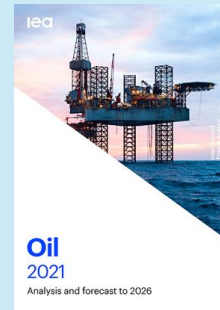
Market Report Series: Oil 2021