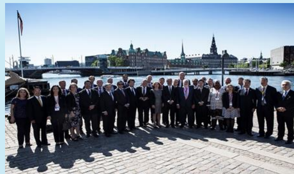
【参考】：第10回会合（2019年5月27日～29日開催）