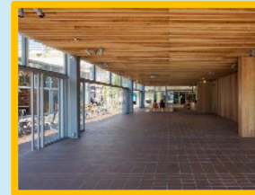
多目的利用スペース