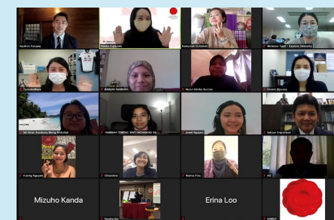
女性起業家交流プログラム （日ASEAN女性起業家リンケージ プログラム、AJWELP）