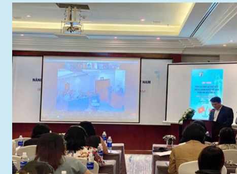
ベトナムでの輸出能力強化ワーク ショップ