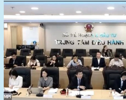
ASEAN諸国高官と日本の投資家との ハイレベル政策対話 （ベトナム投資法・企業法改正ウェビナー）