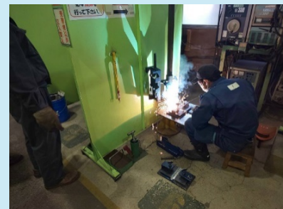
製造分野特定技能1号評価試験 （溶接職種）