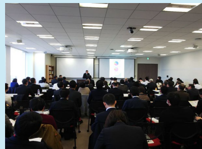
受入れ企業向けセミナーの様様 * 令和元年度の対面開催時