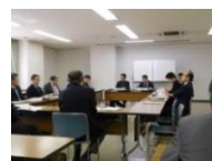
地域エネルギー ビジョンの策定