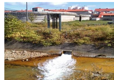
中和処理を行う坑廃水処理施設における省エネルギー設備改修等を実施