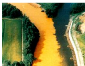
汚染された河川（昭和49年当時）