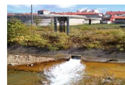
坑廃水処理等の実施