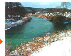
対策を講じた河川（現在）