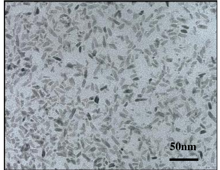
Rutile type TiO 2