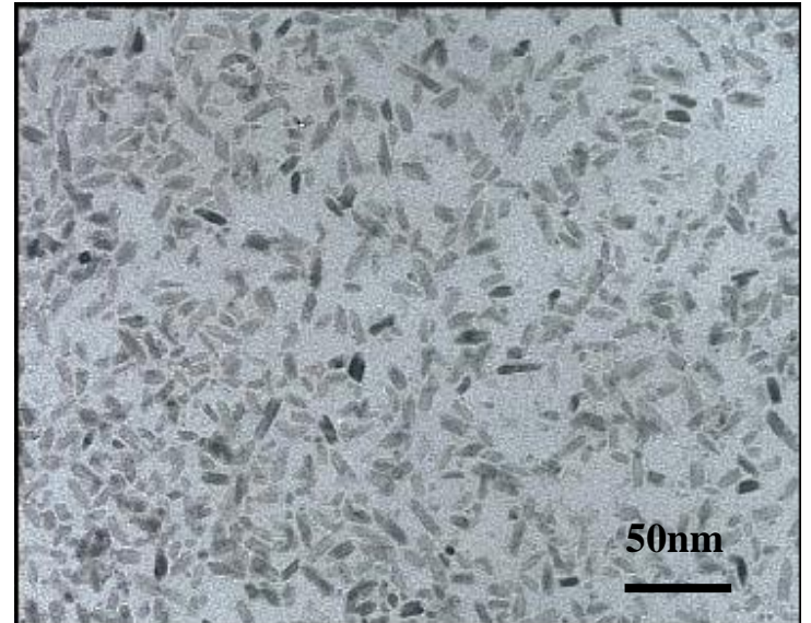
Rutile type TiO 2