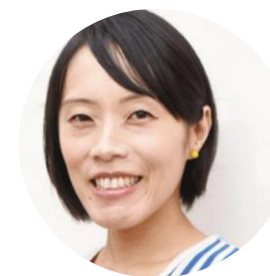
西部沙緒里 「UMU」メディア運営