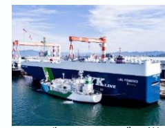
LNGバンカリングの様子