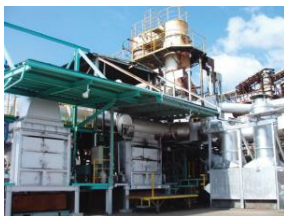
電池の無害化 処理工程