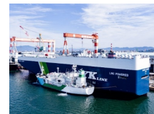
LNG/バンカリングの様子