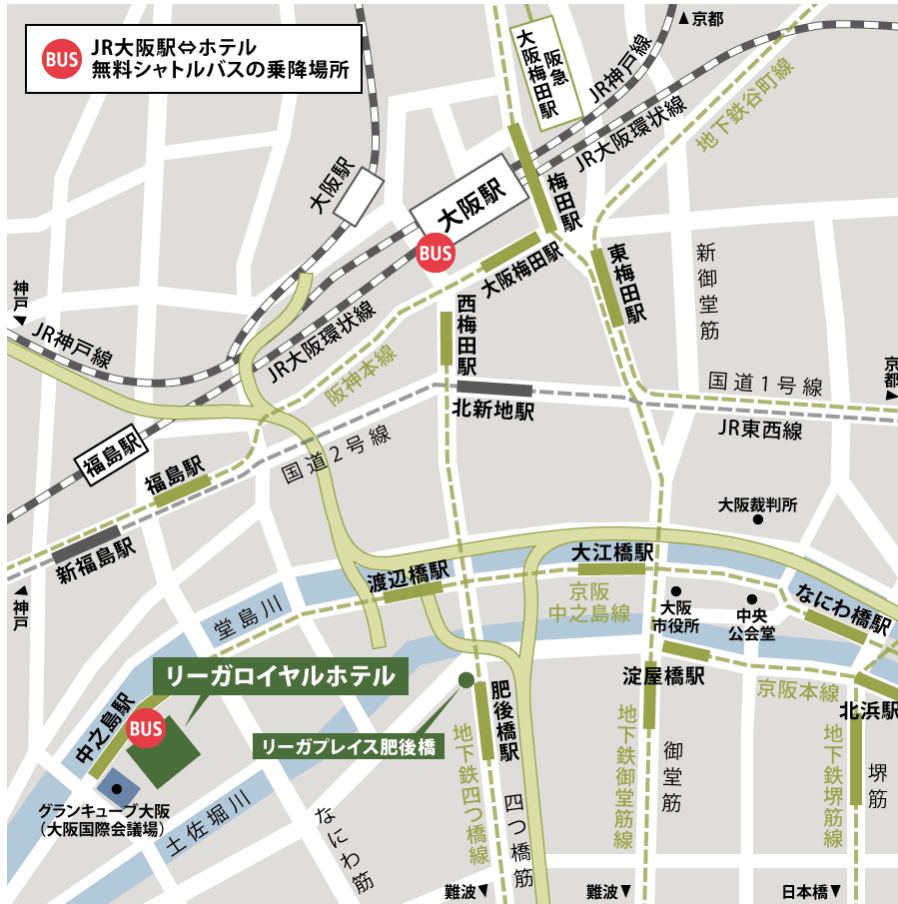
(JR「大阪」駅 シャトルバス乗り場)