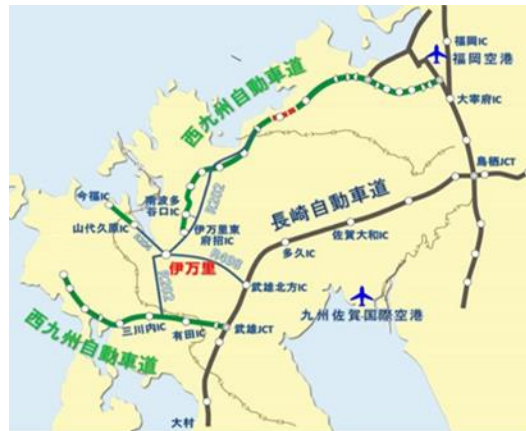
伊万里市の製造業の状況

伊万里市は北部九州の西部に位置し、古くは「古伊万里」と称される肥前陶磁器の積出港として栄え、現在では臨海工業団地を造成し、造船、半導体、木材関連産業等の集積により、近代的な工業港として発展しています。