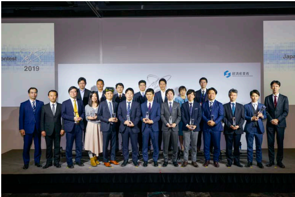
グランプリ決定後のフォトセッション