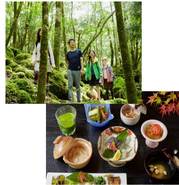
ヘルスツーリズムの取組み