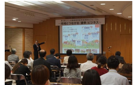
第6回とくしま健康寿命延伸産業創出フォーラム(R1.10.11開催)