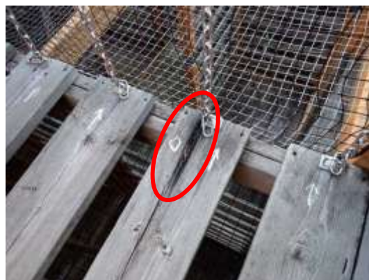
(消費者庁資料より)