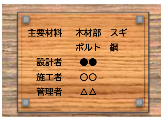
(株式会社矢野経済研究所作成)