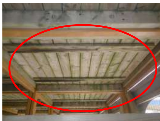
(消費者庁資料より)