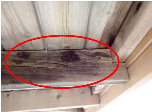
(消費者庁資料より)