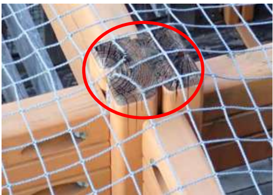
(消費者庁資料より)