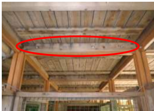
(消費者庁資料より)