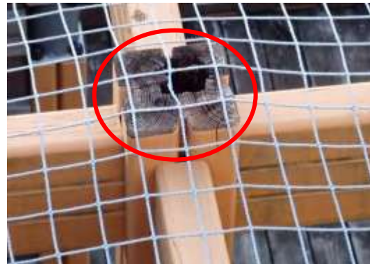
(消費者庁資料より)