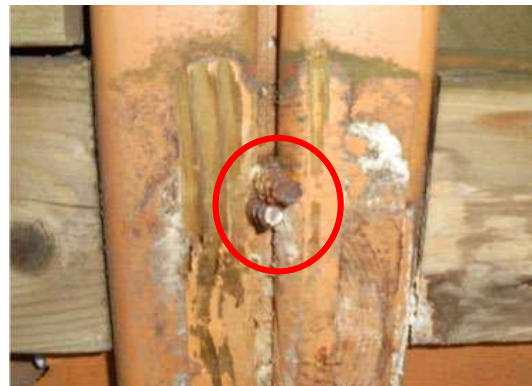
(消費者庁資料より)