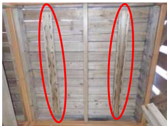
(消費者庁資料より)