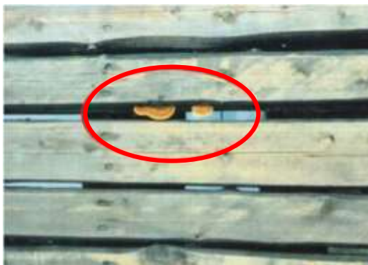
(国道交通省資料より)