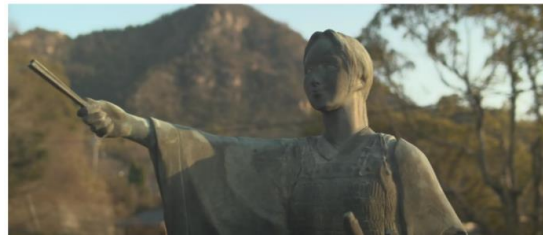
「瀬戸内の秘宝 大三島」PR 動画(3分 ver.)