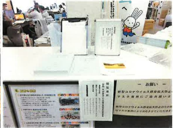
福島市環境部環境課