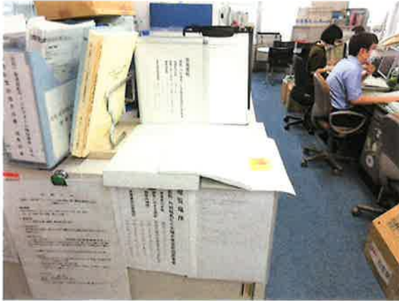
福島県生活環境部環境共生課