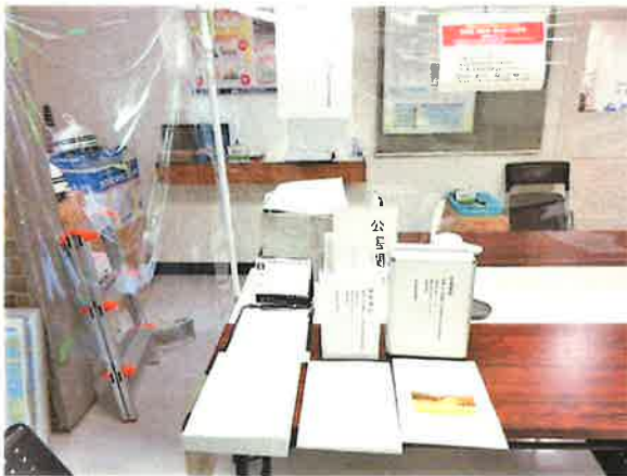
福島市環境部環境課環境保全係