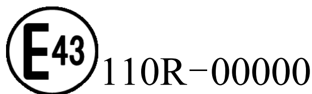
図2. 協定規則第110号に適合する記号の例（円の中の数字は国毎に定める固有の番号、円に続く数字は110、続く数字等は認可番号等）