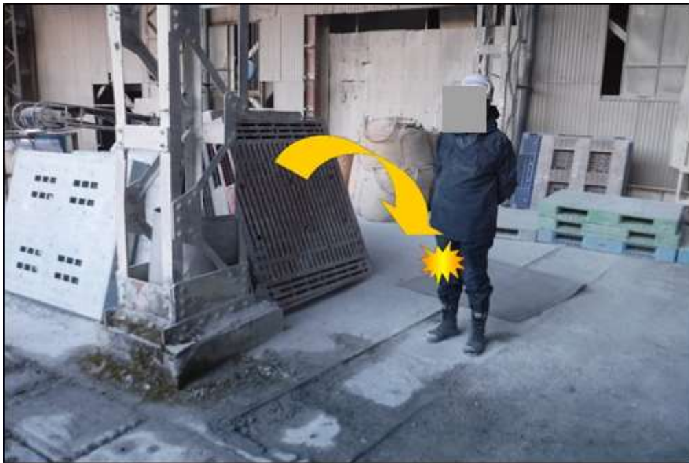
パレットが3枚右ももへ接触