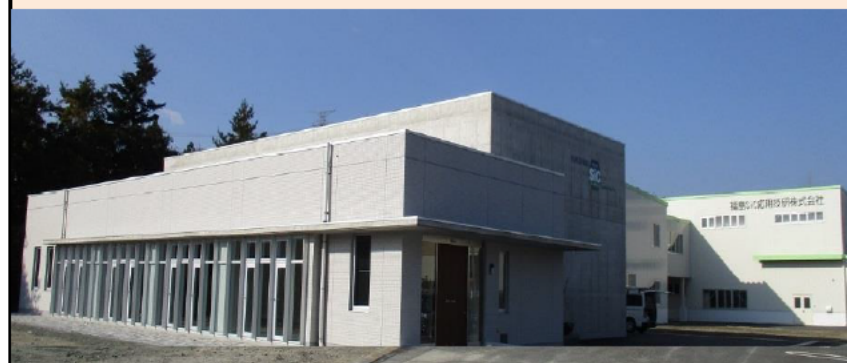
前臨床試験が可能なBNCT研究棟