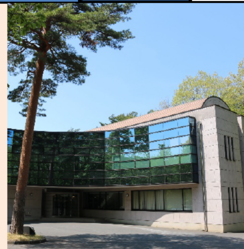
(会社外観) 緑豊かな場所にあります。

お客様の抱える問題をICTで解決することができる、とてもやりがいのある仕事です。業務を通じて得た気づきや知識、お客様からの感謝は、自らの自信となり、仕事への達成感を味わうことが出来る会社です。