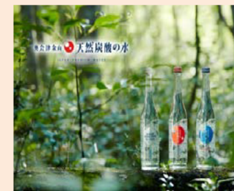
(天然炭酸水、採取福島県)