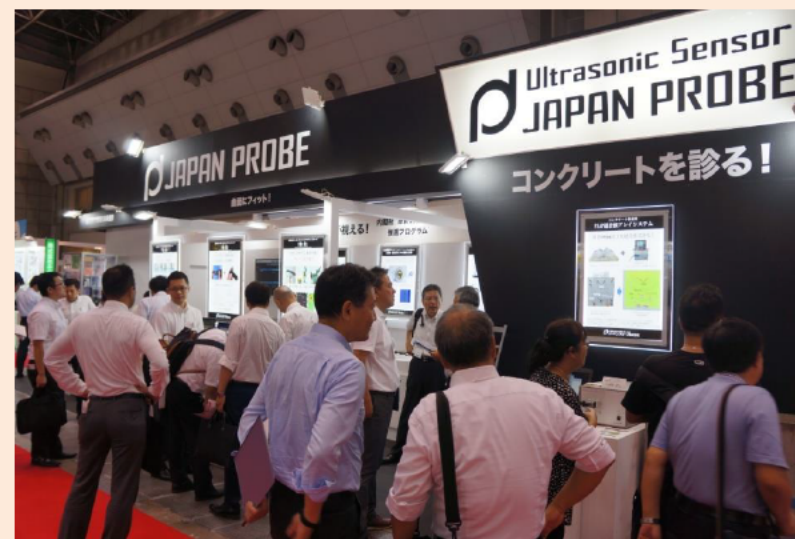
展示会（自社ブース）

○卓越した技術力と多数の実績に裏打ちされた経験を活かし、工業分野以外への販路開拓や海外販売も積極的に展開してまいります。