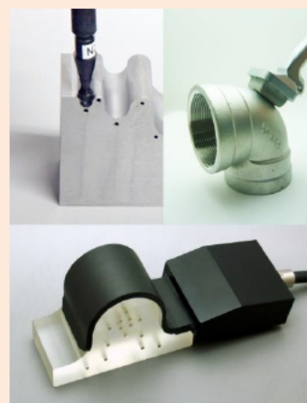
曲がる超音波プローブ