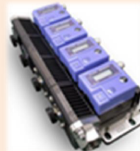
産業用流量計 集積ユニット（マニホールド）