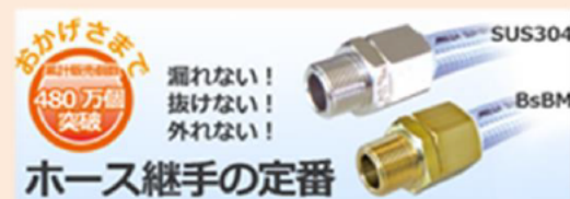
ホース継手の定番