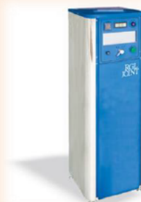
代替クーラント生成器