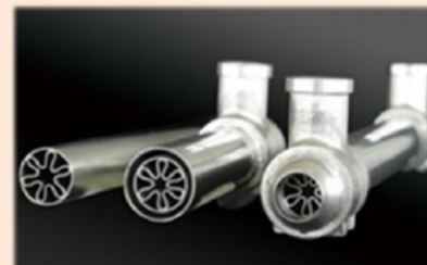
燃料電池システム用 高効率熱交換器

○ 現在、急激な高度経済成長に伴う海外にて環境問題が問題視されています。それらの課題を当社を含めた連携企業の技術・サービスで改善を図るため、東アジア、ASEANへ事業の展開をしていく予定です。