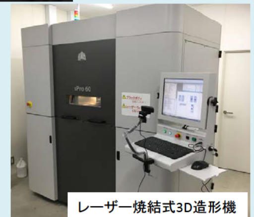
レーザー焼結式3D造形機