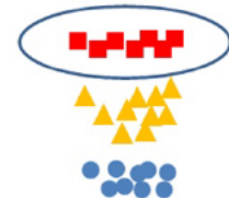
分離精製装置の役割