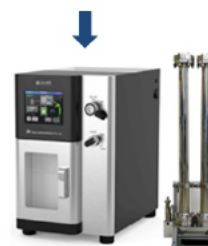
分離精製装置 LaboACE LC-5060