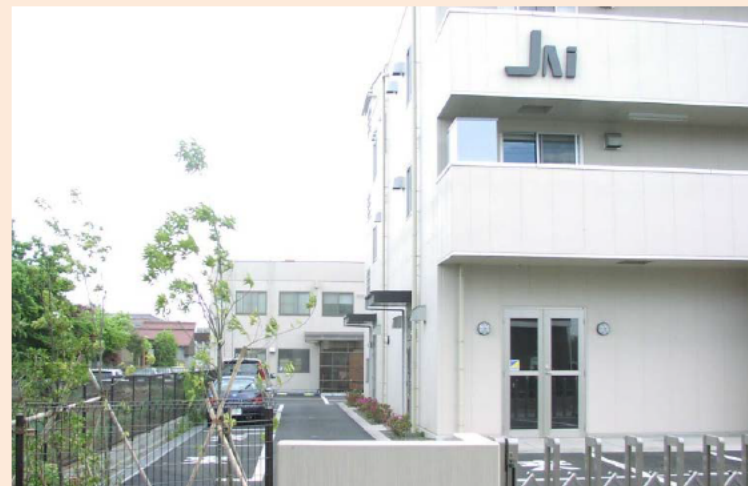
瑞穂町で全商品を製造しています。

○ 現在当社の海外拠点は韓国と中国ですが、近い将来に欧州と米国にも拠点を設立して、顧客サービスの充実をはかります。