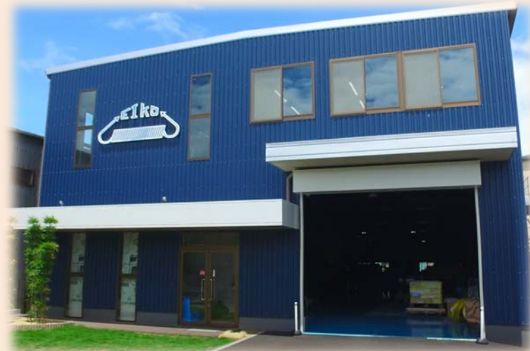
2017年に完成した新社屋

○ばねはもちろん様々な部品に対応できるよう体制を整え、“ものづくりに困った時は栄光技研に”と評価していただけるよう社員一丸となって取り組んでいます。また、現在力を入れている人材教育についても、当社の取り組みを地域に発信し、ものづくり企業を微力ながらけん引していきたいと考えています。