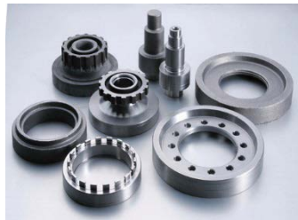
自動車向け パワートレイン部品