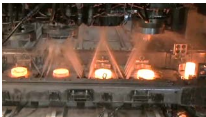
鍛造はテクノロジーの芸術