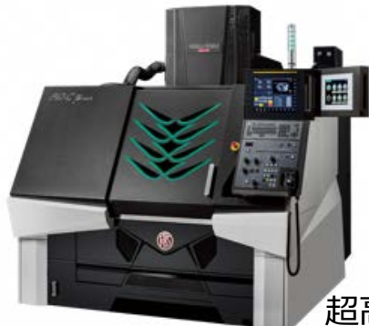
超高精度微細加工機