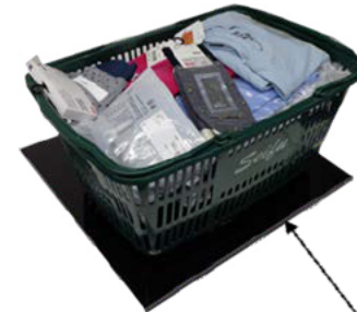
RFID平面アンテナ利用例