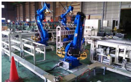
新ラインイメージ写真