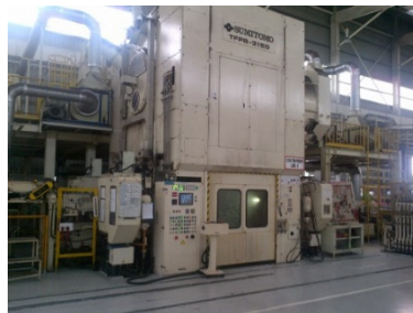
新型プレス（イメージ）