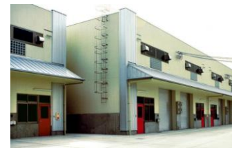
〈宇治ベンチャー企業育成工場〉