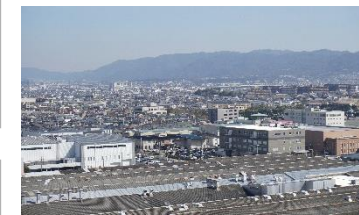
〈京都フェニックス・パーク〉