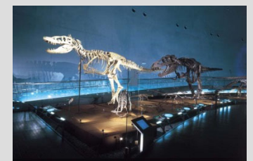
恐竜等の観光資源を軸とした観光地の形成、活性化