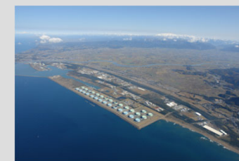
素材産業等の集積を基盤とした技術交流が生み出す成長ものづくり